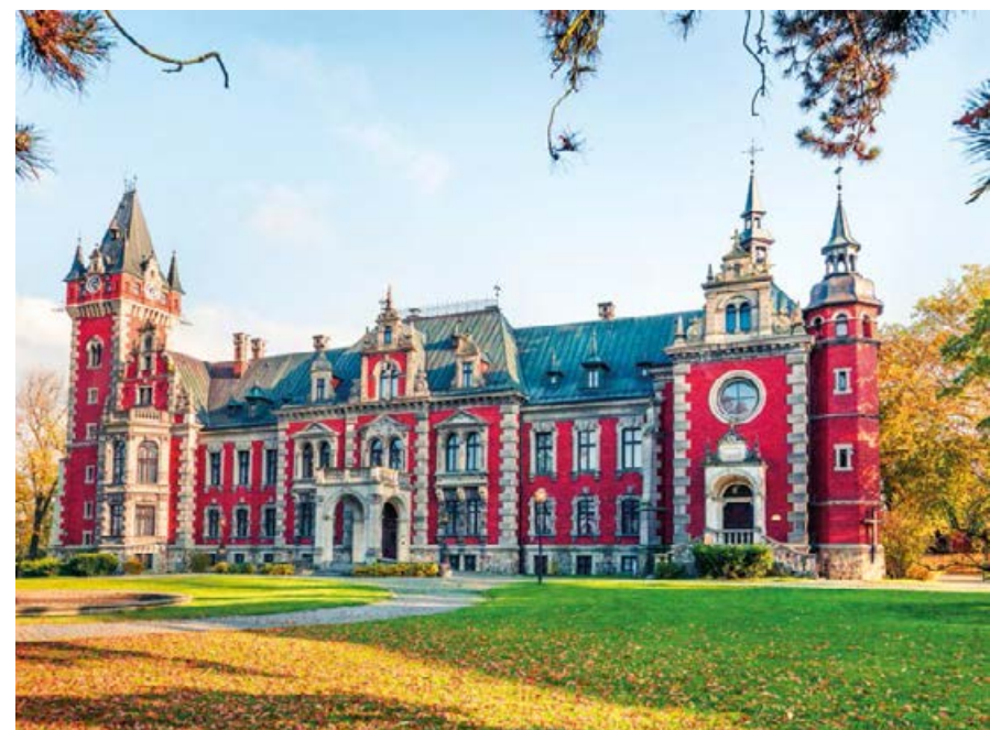
↗ Pałac w Ławniowicach